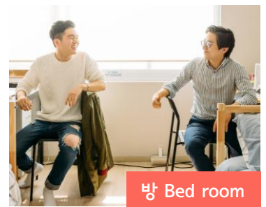
방 Bed room